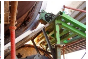
RECTIFICATION : de bandages et de galets sur tubes tournants