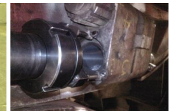
ALESAGE : sur site avec plusieurs types machines de diamètre 40 à 1000 mm