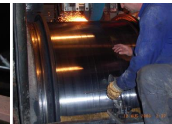
USINAGE SUR SITE : arbres, rotors, fusées, pièces tournantes ou immobiles