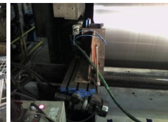
USINAGE, RECTIFICATION, POLISSAGE : sur tous types de cylindres. Longueur 1000 à 5500 mm